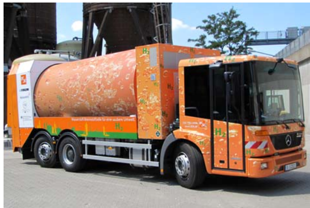
Leises Müllauto für Berlin mit Brennstoffzelle

Am 27. Juni nahm die Berliner Stadtreinigung das weltweit erste Müllfahrzeug in Betrieb, das mit Wasserstoff und Brennstoffzellen arbeitet. Mit der Berliner Firma Heliocentris Energiesysteme GmbH und dem Aufbautenhersteller FAUN wurde, gefördert durch das Bundesverkehrsministerium, ein Fahrzeug entwickelt, das deutlich leiser ist und bis zu 30 % weniger Diesel verbraucht.