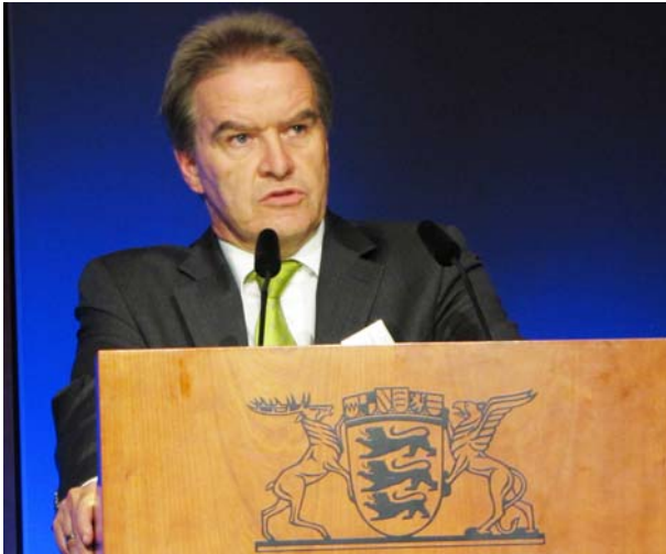
Baden-Württembergs Umweltminister Franz Untersteller