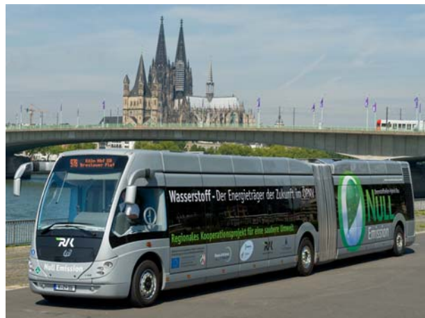
Brennstoffzellenbus im Betrieb in und um Köln

Die Regionalverkehr Köln GmbH (RVK) nahm am 6. Mai 2011 während einer Feierstunde die ersten zwei schadstofffreien Wasserstoff-Hybridbusse im Rheinland in Betrieb. Seit Juni 2011 werden diese Busse im regulären Liniendienst eingesetzt und in einer fünfjährigen Testphase erprobt.