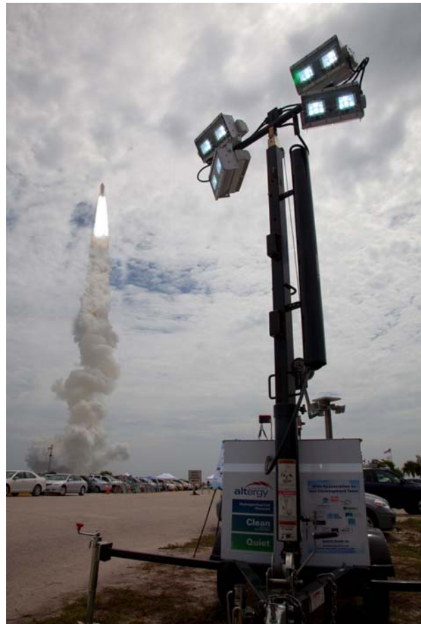
Brennstoffzellen vorn und hinten

Die NASA-Raumfähre Space Shuttle verwendet Brennstoffzellen – nein, nicht mehr, denn am 20. Juli fand der letzte Start statt. Daher waren deutlich mehr Fotografen und Kameralente anwesend als sonst. Brennstoffzellen machten sich dabei auch im Pressezentrum nützlich. Die amerikanische Firma Multiquip lieferte zusätzliches Licht mit Hilfe ihres Hydrogen Fuel Cell Powered Light Tower (H2LT). Außerdem lieferte eine Brennstoffzelle Strom, mit dem die Journalisten die Akkus ihrer Kameras aufladen konnten. Der Einsatz des Systems war der bisherige Höhepunkt einer ganzen Serie von Tests unter ernsthaften Bedingungen. Dazu gehörten die Verleihung der Oscars 2010 und der Grammys und Golden Globes 2011. Das System macht keinen Lärm und hält 68 Stunden durch. Die gewerbliche Produktion soll im letzten Quartal dieses Jahres beginnen.