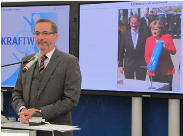
Ministerpräsident Platzeck bei der Eröffnung des Hybridkraftwerks, hinter ihm ein Bild von der Grundsteinlegung gemeinsam mit Bundeskanzlerin Merkel 2009

chen Geschwindigkeit die Energieströme transportieren und speichern kann. ENERTRAG setzt aus diesem Grund auf Wasserstoff und entwickelt gemeinsam mit industriellen Partnern Lösungen auf Basis heimischer Ressourcen, die die Energieversorgung Deutschlands in Übereinstimmung mit den politischen Zielen der Gesellschaft sicherstellen.“