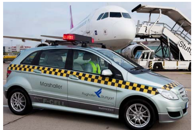
Follow me-Fahrzeug in Stuttgart

In unverkennbarem schwarz-gelben Follow-Me Muster wird die Mercedes-Benz B-Klasse F-CELL künftig die Flugzeuge über die Landebahnen lotsen. Mit einer Leistung von 136 PS und einer Höchstgeschwindigkeit von 170 km/h fährt sie lokal emissionsfrei und ist damit richtungsweisender Anführer, nicht nur für die Maschinen am Flughafen. An der Wasserstofftankstelle, die 2009 direkt am Flughafencampus eröffnet wurde, kann das Follow-Me Fahrzeug innerhalb von nur drei Minuten mit Wasserstoff betankt werden und erzielt dann eine Reichweite von rund 400 km. „Damit bleiben wir am Puls der Zeit was die technologische Antriebsentwicklung am Boden betrifft“, sagt Walter Schoefer, Geschäftsführer der Flughafen Stuttgart GmbH.