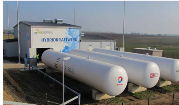
Elektrolysehalle und Speichertanks

Von grüner Mobilität wurde nicht nur geredet, man konnte sie auch ganz praktisch „erfahren“. Brennstoffzellenautos von Daimler, General Motors, Audi und Honda standen bereit, so dass Interessenten eine kleine Runde drehen konnten.