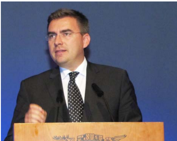
Parlamentarischer Staatssekretär Jan Mücke vertrat das Bundesverkehrsministerium

Bei Baden-Württemberg spielt natürlich die Autoindustrie eine bedeutende Rolle. So stand das Thema der vernetzten Mobilität im Mittelpunkt. Mobile und stationäre Anwendungen wachsen immer mehr zusammen, wozu nicht zuletzt der Wasserstoff als verbindendes Element beiträgt. Das gastgebende Bundesland vertrat Umweltminister Franz Untersteller.