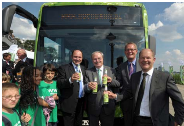
Darauf ein kühles Wasser - neuer Brennstoffzellenbus in Hamburg

Seit 2003 setzt die Hochbahn mit Erfolg auf die Weiterentwicklung wasserstoffbetriebener Brennstoffzellenbusse. Mit bis zu neun Bussen im Linienbetrieb konnten wichtige Ergebnisse für die Produktion der neuesten Generation an den Hersteller geliefert werden. Die nun weltweit erstmals im Linienbetrieb eingesetzten neuen Brennstoffzellenhybridbusse können Bremsenergie rückführen und in Lithium-Ionen-Batterien speichern. Das Ergebnis: Mit voraussichtlich 10 kg Wasserstoff pro 100 km soll der Verbrauch auf die Hälfte gesenkt werden. Die neue Busgeneration verfügt neben der neuen Hybridtechnologie über leistungsstarke Elektromotoren in den Radnaben, elektrifizierte Nebenaggregate und weiterentwickelte Brennstoffzellen. Die Haltbarkeit der Brennstoffzellen soll auf mindestens sechs Jahre oder 12000 Betriebsstunden vergrößert werden. Das Vorhaben ist Teil der Clean Energy Partnership