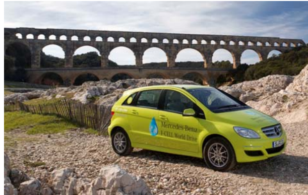
Alte Wege und neue Technik

Im Rahmen eines Festakts genau 125 Jahre später am 29. Januar 2011 in Stuttgart gaben Bun-