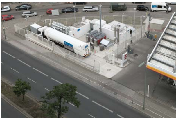
Tankstelle Sachsendamm von oben

Die derzeit leistungsfähigste Wasserstoff-Tankstelle der Welt steht in Berlin am Schöneberger Sachsendamm. Es ist auch die erste derartige Shell-Station in Deutschland. Sie ist Teil der Clean Energy Partnership (CEP) und wurde am 20. Juni in Betrieb genommen. Die CEP wird im Rahmen des NIP von der Bundesregierung finanziell unterstützt.