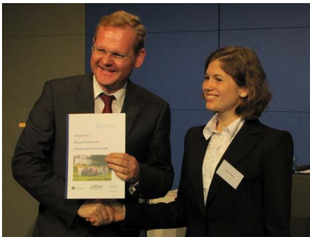
Übergabe des Bürgergutachtens

Nach skandinavischen Vorbildern hat das Berliner Unabhängige Institut für Umweltfragen (UfU) im Rahmen des NIP und mit finanzieller Unterstützung daraus in dem Projekt „HyTrust“ eine „Bürgerkonferenz“ organisiert. Eine Gruppe von 16 Personen aus Berlin und Umgebung wurde zusammengestellt, die zum einen weitgehend zufällig ausgewählt wurde, andererseits aber auch bestimmte Kriterien erfüllen musste. Zum Beispiel durfte niemand von ihnen beruflich oder anderweitig mit dem Thema bisher zu tun gehabt haben. An drei Wochenenden im April und Mai dieses Jahres informierten sich die Teilnehmer der Konferenz intensiv über die Wasserstoff- und Brennstoffzellentechnologie im Mobilitätssektor, diskutierten miteinander und formulierten abschließend das Gutachten. Sie trafen auf Verkehrsexperten, Klimaforscher, Vertreter der Automobil- und aus der Zulieferindustrie, sie konnten Bundestagsabgeordnete interviewen, selbst Wasserstoffautos fahren und wurden visuell durch einen Zeichner unterstützt.