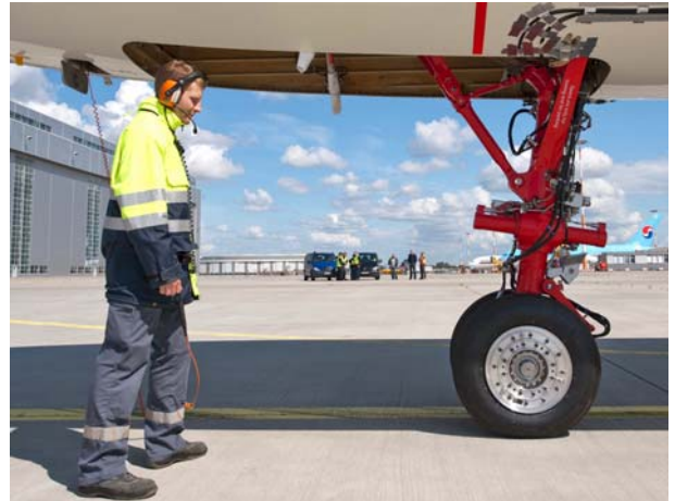
Elektrisches Bugrad im Rollversuch

Angetrieben durch ein elektrisches Bugrad rollte das DLR-Forschungsflugzeug A320 ATRA (Advanced Technology Research Aircraft) im Juni 2011 über den Flughafen in Hamburg-Finkenwerder (Airbus-Werksflugplatz). Bei den am 30. Juni 2011 erfolgreich abgeschlossenen Rollversuchen testeten Forscher und Ingenieure des Deutschen Zentrums für Luft- und Raumfahrt (DLR), von Airbus und von Lufthansa Technik erstmals ein mit