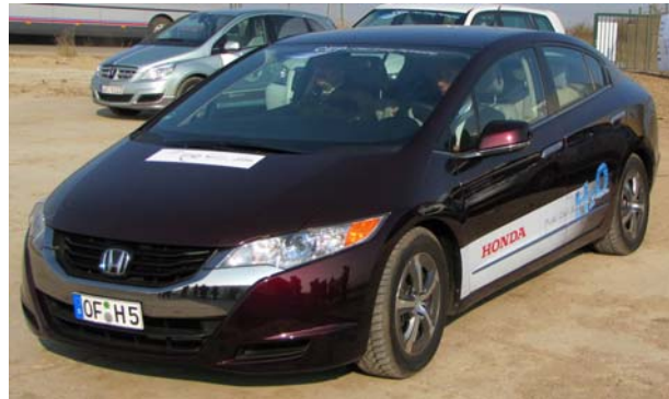
Honda FCX Clarity

kunft und zählt zu den erklärten Wachstumstreibern des Konzerns, der seit über 40 Jahren Know-how für die gesamte Wasserstoff-Versorgungskette entwickelt. Diesen Erfahrungsschatz wird Air Liquide in die CEP einbringen.