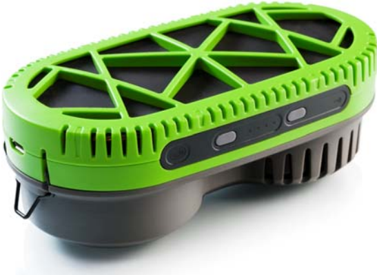
Das Ladegerät PowerTrek

Ladegeräte für netzferne Anwendungen von Elektronik kommen jetzt auf den Markt. Einer der Anführer ist die schwedische Firma myFC. PowerTrek ist ein taschengroßes leichtes Ladegerät für Nutzer, die viel Zeit abseits von Stromnetzen verbringen. Es sorgt überall sofort für Strom. Mit seinem stabilen, wasserdichten Gehäuse und