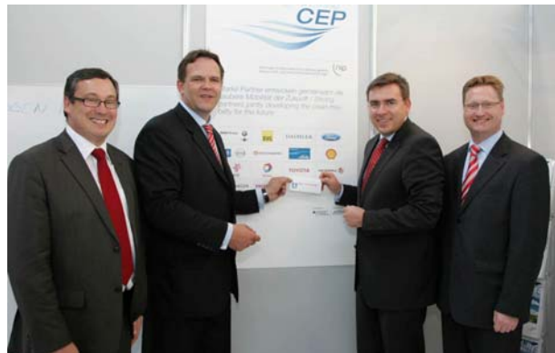
Beitrittspresskonferenz mit Vertretern der CEP, Air Liquide, BMVBS und NOW (v. l. n. r.)

Honda betreibt seit Mitte der 1980er Jahre Forschung und Entwicklung auf dem Gebiet der Brennstoffzelle und hat in den letzten 10 Jahren eine beachtliche Anzahl an Brennstoffzellen-Elektrofahrzeugen weltweit an Kunden ausgeliefert. Für Honda ist es daher ein konsequenter Schritt, den FCX Clarity, der seit September 2009 auf europäischen Straßen unterwegs ist, in die CEP zu bringen.