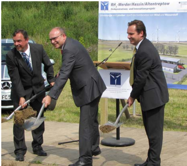
Mit vereinten Kräften: Landesregierung, Betreiber und NOW

gebettet in einen neuen Windpark, welcher parallel nördlich von Neubrandenburg in Mecklenburg-Vorpommern errichtet wird. Das Vorhaben trägt den Namen „RH2-WKA“.