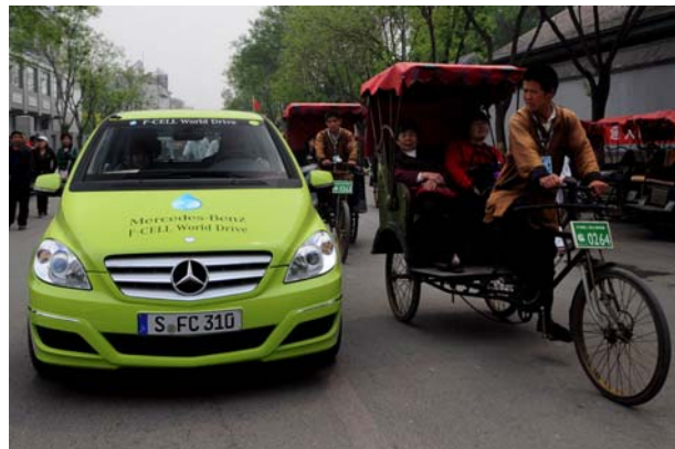
Emissionsfreie Fahrzeuge in Peking