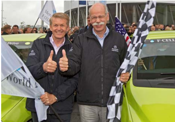
Willkommen zu Hause!

sche Reife der Brennstoffzellentechnologie sowie die Alltagstauglichkeit der Fahrzeuge.