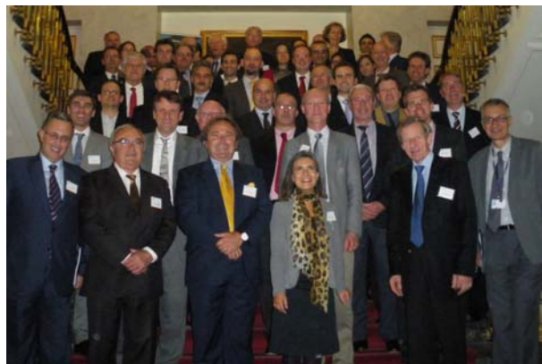
Die Partner von HyER blicken optimistisch in die Zukunft

Grund zum Feiern hatten am 28. Oktober 2011 in Brüssel die Vertreter von 32 europäischen Regionen und Kommunen, die sich den beschleunigten Einsatz von batterie- und brennstoffzellenelektrischen Fahrzeugen und den Aufbau der dazu gehörenden Infrastruktur zum Ziel gesetzt haben. Der gesamte Bereich der rein batterieelektrischen Fahrzeuge einschließlich ihrer Infrastruktur kam zu den brennstoffzellenelektrischen Fahrzeugen, so dass die Initiative jetzt wirklich alles abdeckt, was elektrisch fährt. In Anwesenheit von Vertretern der Europäischen Kommission wurde der alte Name HyRaMP durch „HyER“, Hydrogen Fuel Cells and Electromobility for European Regions, ersetzt. Arbeitsplan und Satzung wurden den erweiterten