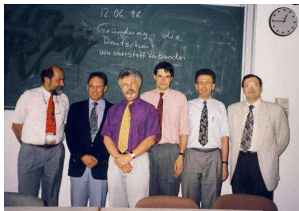
DWV-Gründung am 12. Juni 1996

Mittlerweile kann das Kind hervorragend laufen und sprechen. Der DWV ist heute der professionelle und kompetente Ansprechpartner für Medien und Politik zu allen Fragen rund um Wasserstoff und Brennstoffzelle. Wasserstoff ist nicht mehr der Kraftstoff der Zukunft – er ist heute Realität, auch wenn er noch am Anfang steht. Elektromobilität ohne Wasserstoff und Brennstoffzelle würde nur ein Nischenmarkt bleiben. Und immer deutlicher wird auch, dass der Speicherbedarf für Energie, der durch den stetig steigenden Marktanteil der Erneuerbaren entsteht, nicht ohne die Systemkomponente Wasserstoff gedeckt werden kann. Der DWV tut nicht so, als habe er das ganz allein bewirkt, aber er ist stolz darauf, seinen Teil zu dieser Entwicklung beigetragen zu haben.