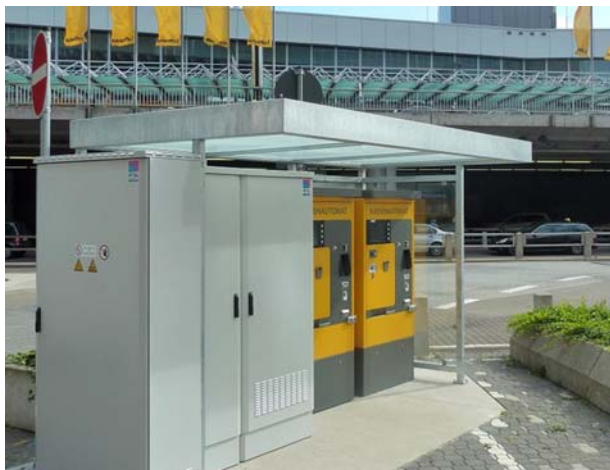
Unauffällig im grauen Kasten steckt die Brennstoffzelle

AG. Der Flughafenbetreiber plant die Brennstoffzellentechnik zukünftig in noch weiteren Anwendungsbereichen des Airports einzusetzen.