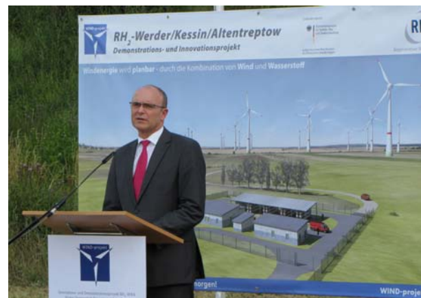
Ministerpräsident Sellering vor dem ersten Spatenstich

Die WIND-Projekt Ingenieur- und Projektentwicklungsgesellschaft mbH (WIND-Projekt) vollzog am 7. Juli im Beisein des Ministerpräsidenten Mecklenburg-Vorpommerns Erwin Sellering den Ersten Spatenstich für eine innovative Energiespeicheranlage. Die CO 2 -freie Energiespeicheranlage ist ein-