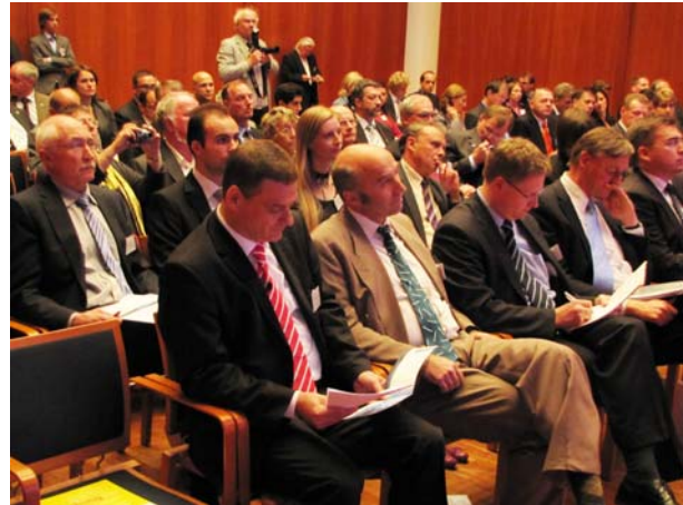
Blick in den großen Saal der Landesvertretung Baden-Württembergs

„Für eine zukunftssichere und nachhaltige Energieversorgung, die sowohl umwelt- und klimaverträglich als auch bezahlbar und gesellschaftlich akzeptiert ist, ist ein Systemwechsel hin zu elektrischen Antrieben erforderlich“, erklärte der Minister. „Dabei brauchen wir die Brennstoffzelle, da sie in allen Fahrzeugsegmenten bis hin zu Bussen eingesetzt werden kann und so langfristig ein weitgehend CO 2 -freies Verkehrssystem ermöglicht“. Wesentliche Voraussetzung hierfür sei, dass regenerativer Wasserstoff getankt werde, der aus erneuerbaren Energien gewonnen werde. Baden-Würt-