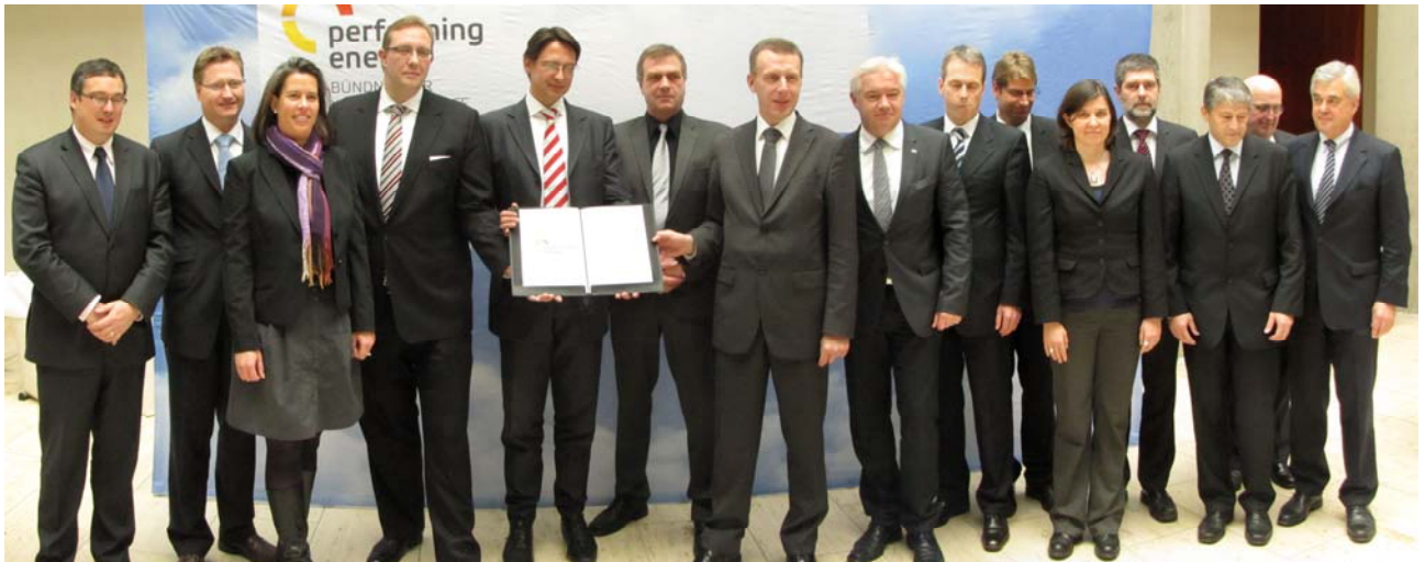
Die Partner des Bündnisses für Windwasserstoff: 14 Firmen, Forschungseinrichtungen und Verbände sowie drei Bundesländer

Die Partner der Initiative „performing energy“ beabsichtigen, die technische Machbarkeit und die Wirtschaftlichkeit großer Wind-Wasserstoff-Systeme zu erforschen, unter Alltagsbedingungen zu testen und mittelfristig zur Marktreife zu bringen. Für drei aufeinander abgestimmte Demonstrationsprojekte in Brandenburg und Schleswig-Holstein haben die Partner einen gemeinsamen Förderantrag gestellt und bei positiver Bewilligung soll in den Projekten die gesamte Wertschöpfungskette des Wind-Wasserstoffs über die Energiebereiche Strom, Wärme und Mobilität abgebildet werden.