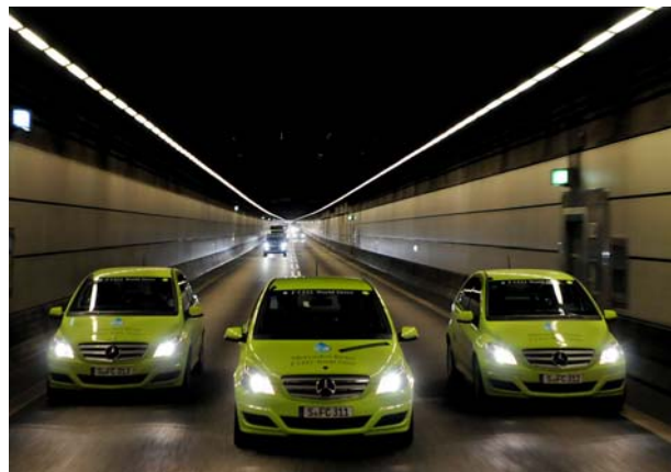
Durch den Elbtunnel

deskanzlerin Angela Merkel und Dieter Zetsche, Daimler-Vorstandsvorsitzender, den symbolischen Startschuss für den Mercedes-Benz F-CELL World Drive. Von Stuttgart aus starteten drei Mercedes-Benz B-Klassen mit lokal emissionsfreiem Elektroantrieb mit Brennstoffzelle am 30. Januar eine 125-tägige und 30.000 km lange Fahrt um die Welt. Über vier Kontinente und durch 14 Länder fuhren die drei Autos einmal rund um den Globus, bis zum Ausgangspunkt Stuttgart, wo sich der „Weltkreis“ wieder schloss. Mercedes-Benz untermauerte mit dem F-CELL World Drive die techni-